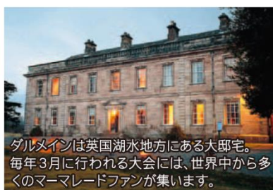
ダルメインは英国湖水地方にある大邸宅。毎年3月に行われる大会には、世界中から多くのマーマレードファンが集います。

2021年5月、みかんの花が咲き、甘い香りが街全体を覆う時期に日本大会は行われます。第3回大会となる今回も、様々な種類の柑橘を生産する日本ならではのマーマレードの祭典として、マーマレード作りの楽しさ、奥深さが一人でも多くの人に伝わり、マーマレードの魅力を日本中・世界中に広めていければと願っています。