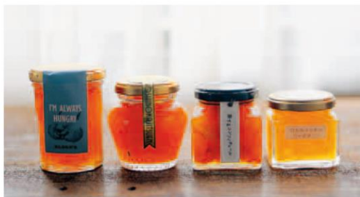
(写真は第1回大会のベストカテゴリー賞作品)