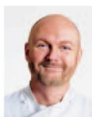
ダン レパード 英国大会審査員