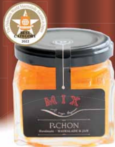
カテゴリー③ ミックス 「伊予柑&りんごミックス」 P★CHON (愛媛県)