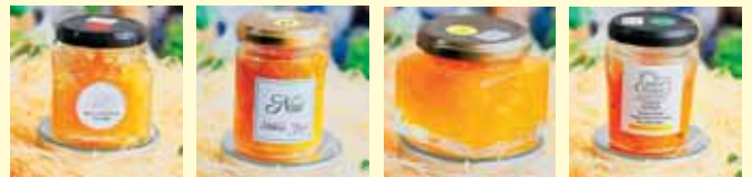
CROSS partnership design株式会社