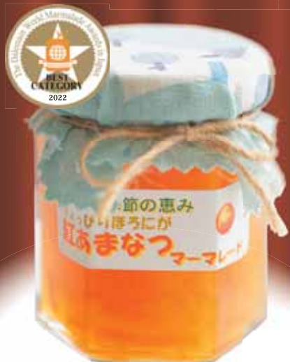
カテゴリー① かんきつ1種 「季節の恵み ちょっぴりほろにが 紅あまなつマーマレード」 手作りジャム 季節の恵み (石川県)