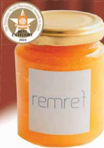
カテゴリー② 複数かんきつ 「コンフィチュール 柚子ポンカン」 remref (石川県)