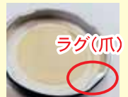
ツイストキャップ